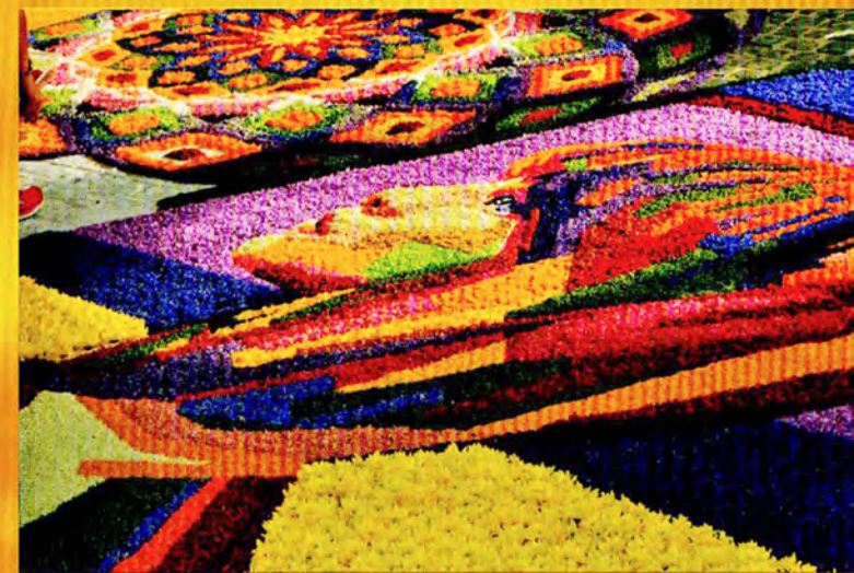
Foto di Laura Carletti di San Martino in Campo - PG Prima Classificata del concorso di Arte Fotografica 2017

XXIX Trofeo Infiorate Spello 2018 Il Premio Nazionale Città delle Infiorate 2018